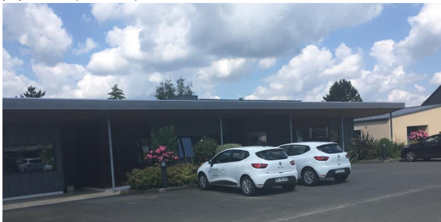
Site de l'agglomération à Bourbriac

Les années 2017 et 2018 ont été marquées par l'élaboration du schéma de développement et par la signature de la convention cadre de partenariat avec la Région. Pour mettre en œuvre cette stratégie, le service basé à Bourbriac a eu pour mission notamment d'accompagner les porteurs de projets, superviser la gestion et le développement de l'offre foncière et immobilière, mener des actions d'animation économique et établir des liens avec les réseaux d'entreprises et les partenaires économiques. Avec un budget de 14,3 millions € dédié au développement économique et aux grands projets, la compétence économique est le 3 ème plus grand budget de l'agglomération derrière l'environnement (39.8 M €) et les services à la population (29.7 M €).